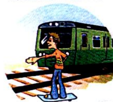
Кататься вблизи железной дороги.