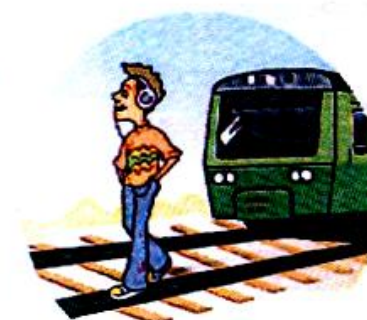
Слушать плеер и говорить по телефону вблизи железной дороги.