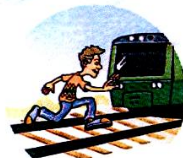
Перебегать пути перед поездом.

Слушать плеер и говорить по телефону, т. к. можно не услышать сигналы приближающегося поезда и объявления диктора.